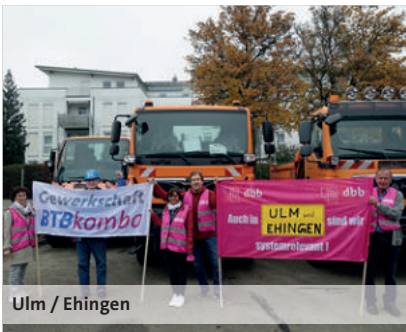
Ulm / Ehingen