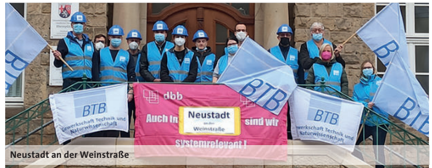
Neustadt an der Weinstraße